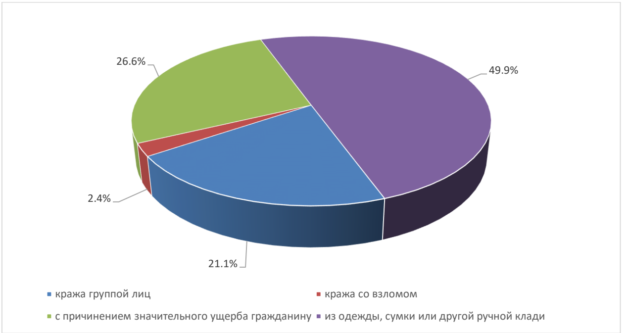
Рисунок 2 – Структура краж в г. Сочи в 2021 году, %